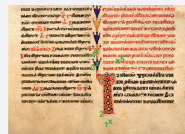
Untersuchung der Handschrift Cod. Slav. 8 der ÖNB, Wien

Bei der Analyse von Handschriften können mit Hilfe der RFA wertvolle Informationen über die vorkommenden Elemente der verwendeten Tinten gewonnen und damit Rückschlüsse auf die Pigmente gezogen werden.